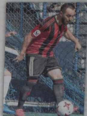
Goleada de los mineros.